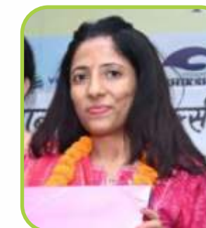
Dr. Kanta Galani Central Sanskrit University Jaipur